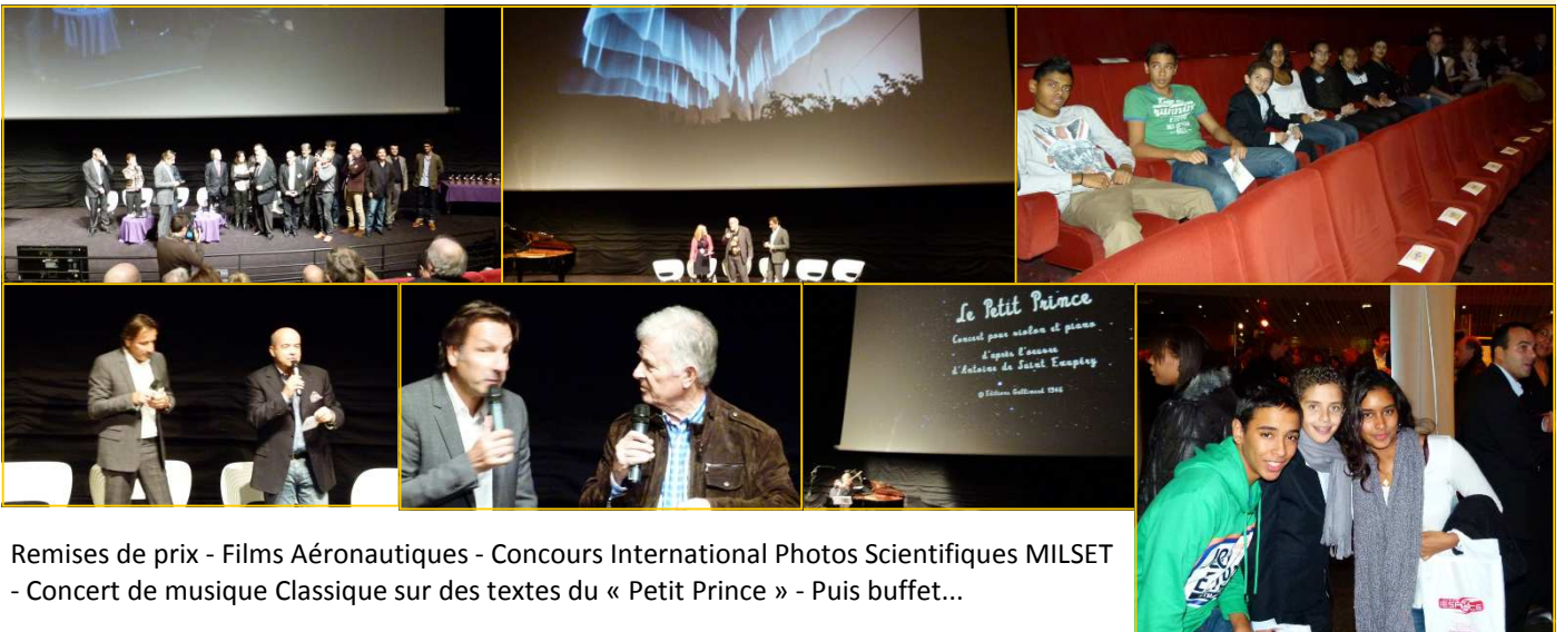
Remises de prix - Films Aéronautiques - Concours International Photos Scientifiques MILSET - Concert de musique Classique sur des textes du « Petit Prince » - Puis buffet...