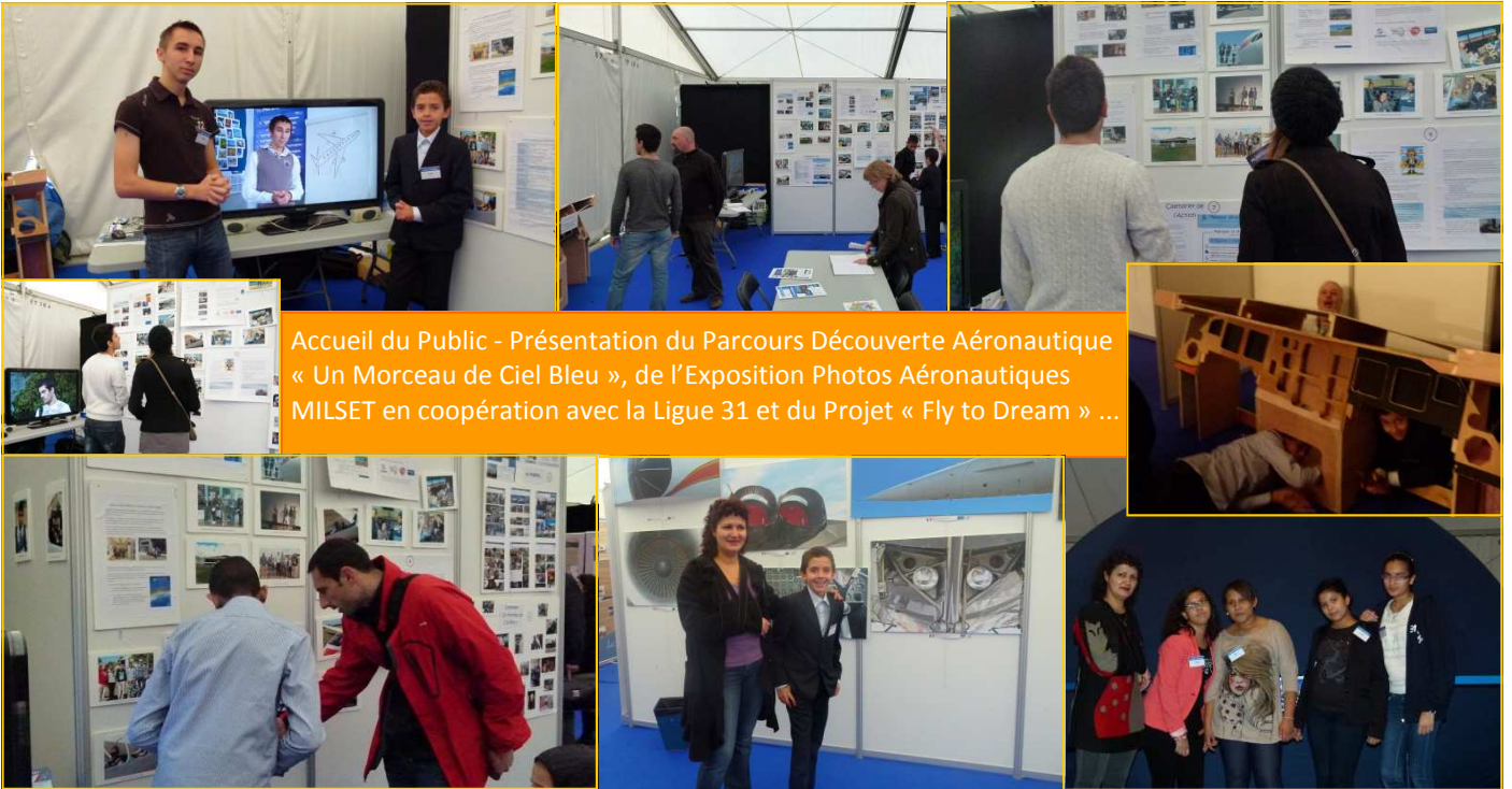
Accueil du Public - Présentation du Parcours Découverte Aéronautique « Un Morceau de Ciel Bleu », de l'Exposition Photos Aéronautiques MILSET en coopération avec la Ligue 31 et du Projet « Fly to Dream » ...