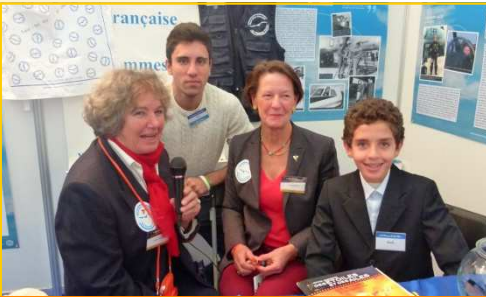
Rencontre avec l'Association des Femmes Pilotes et petit interview