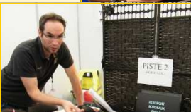
Rencontre avec l'Association « Délires d'Encres »