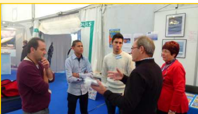
Rencontre avec Aviation Sans Frontières