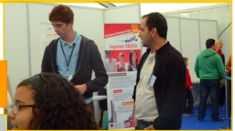
Rencontre les étudiants d'ISAE