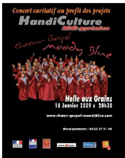
Affiche concert 2009